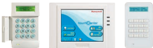
Clavier LCD MK7